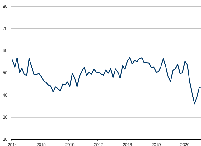
Abb. 5: Beschäftigung nimmt im Dienstleistungssektor ab Wachstumsschwelle = 50

Keine Verbesserung gab es im August hinsichtlich der Arbeitsmarktlage. Die Subkomponente «Beschäftigung» schloss unverändert zum Vormonat auf 43.6 Zählern. Damit hat sich der seit März andauernde Stellenabbau im Dienstleistungssektor fortgesetzt.