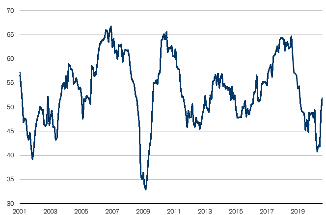
Abb. 1: Industrie-PMI über der Wachstumsschwelle Wachstumsschwelle = 50

Der procure.ch Purchasing Managers' Index (PMI) für die Industrie ist im August über die Wachstumsschwelle von 50 Punkten geklettert (vgl. Abb. 1). Mit einem Wert von 51.8 Zählern liegt der Industrie-PMI zudem auf dem höchsten Wert seit 18 Monaten und erstmals seit März 2019 wieder in der Wachstumszone.