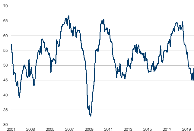
Abb. 1: PMI Industrie knapp unter Wachstumszone Wachstumsschwelle = 50

auf 49.2 Zähler ebenfalls nahe an die Wachstumsschwelle) und die Subkomponente «Beschäftigung» sogar über dieser notiert – Spiegelbild dafür, dass sich die Arbeitsmarktlage nicht eintrübt. Verhaltener präsentiert sich hingegen die Auftragslage: Mit 45.6 Zählern liegt die Subkomponente «Auftragsbestand» deutlich unterhalb der Wachstumszone, was in Zukunft keine Produktionssteigerungen erwarten lässt.