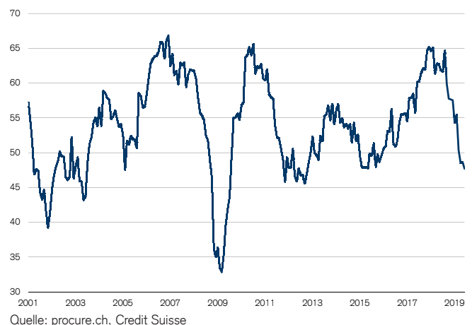
Abb. 1: PMI Industrie rutscht weiter ab Wachstumsschwelle = 50

Angesichts der verschlechterten Auftragslage kauften die Unternehmen im Juni deutlich weniger ein als im Vormonat. Die entsprechende Subkomponente schloss mit 42.4 Zählern um 6.3 Punkte tiefer als im Mai und deutlich unter der Wachstumsschwelle.