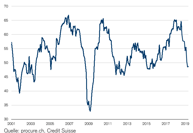
Abb. 1: PMI Industrie fängt sich Wachstumsschwelle = 50

Vormonat. Darauf lässt zumindest der Anstieg der Subkomponente «Auftragsbestand» um 0.7 Punkte auf 46.6 Zähler schliessen. Praktisch nicht verändert haben sich die Lieferfristen: Die entsprechende Subkomponente verharrte unterhalb der Wachstumsschwelle auf 48.6 Zählern – was eine marginale Unterauslastung der bestehenden Kapazitäten signalisiert.