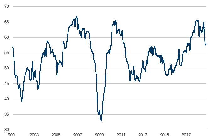
Abb. 1: Sinkflug des PMI Industrie gestoppt Wachstumsschwelle = 50

Im November notierte der procure.ch Purchasing Managers' Index (PMI) auf einem Stand von 57.7 Zählern und damit praktisch auf dem Wert des Vormonats (+0.2 Indexpunkte). Offensichtlich konnte der Abwärtstrend des PMI der vergangenen zwei Monate gestoppt werden (vgl. Abb. 1). Der PMI für die Industrie liegt nach wie vor nicht nur weit in der Wachstumszone, sondern auch über seinem langfristigen Durchschnitt von 55 Punkten, und ist damit das Spiegelbild einer immer noch vergleichbar robusten Industriekonjunktur.